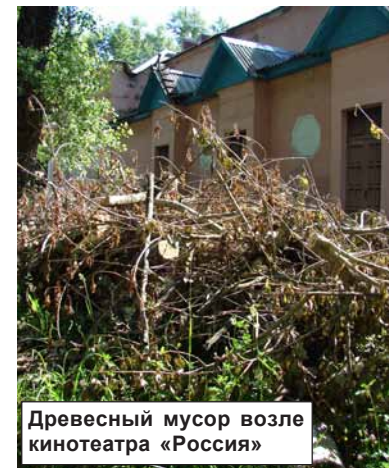
Древесный мусор возле кинотеатра «Россия»