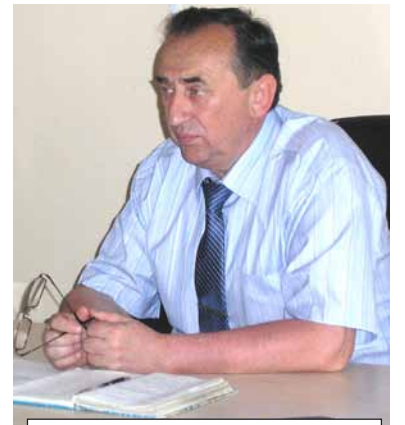
Исполняющий полномочия Главы Администрации города Ярцево В.И. Ковалев

газета муниципального образования "Ярцевский район" Смоленской области наш сайт: вести-приволья.рф